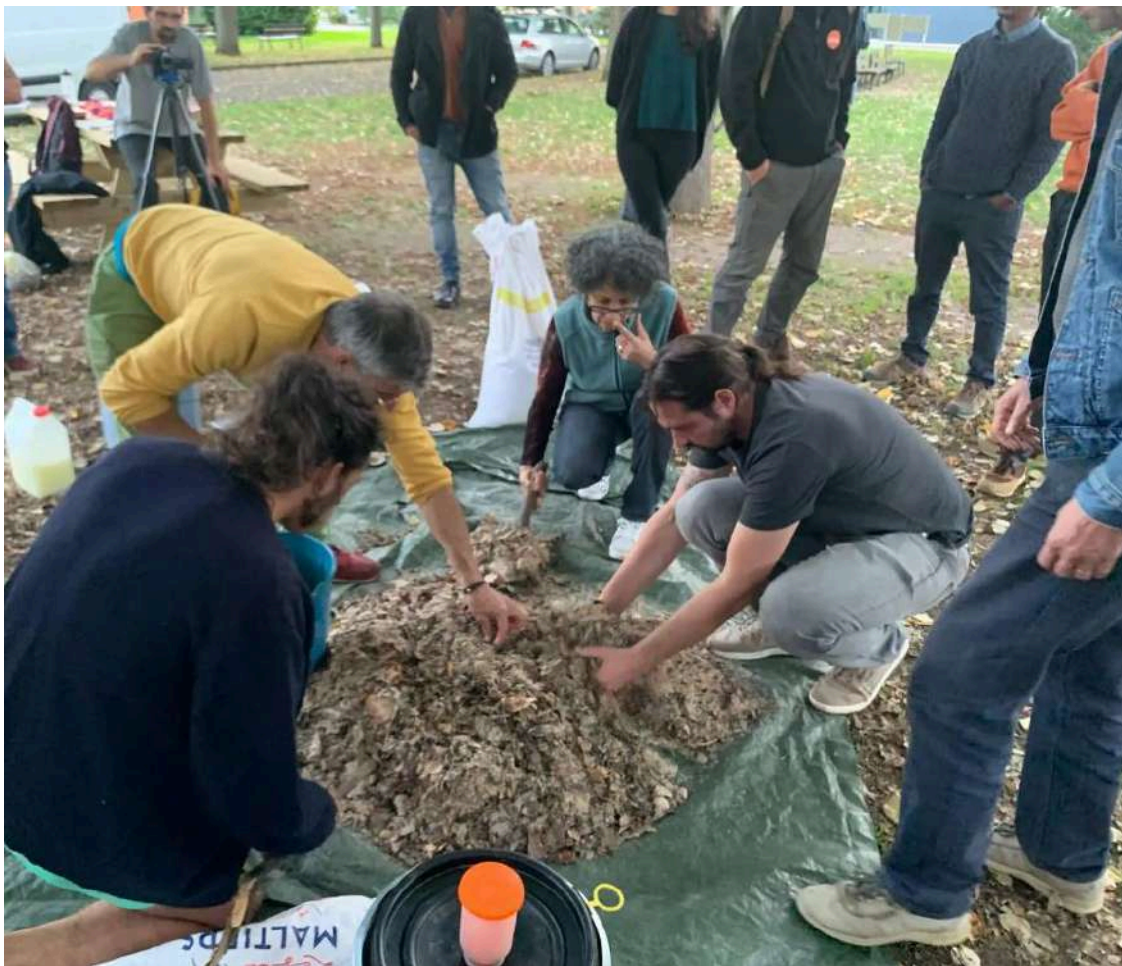
Rouffach, Atelier Lifofer au Lycée Agricole de Rouffach, Journées MSV Grand Est 2024