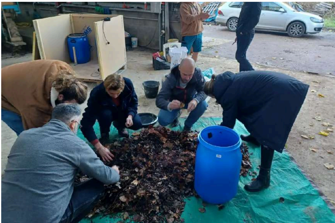
Chablis, Mélange des solide et étuve bricolée pour fermentation.